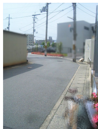
施設空き状況は要確認