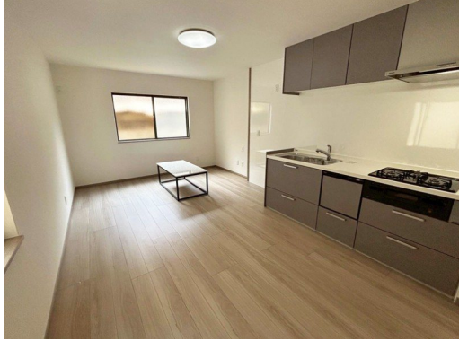
有効土地面積約55.61㎡ 建ぺい率超過