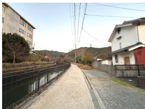
前面道路非道路 風致地区第3種地域