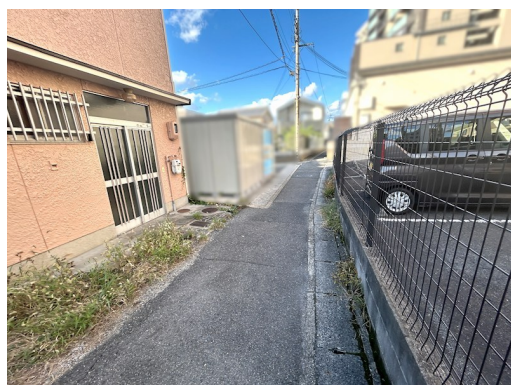
全面道路:建築基準法第42条2項道路、山科区榎辻5号線