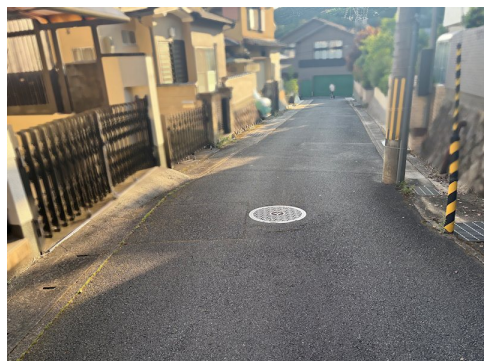
風致地区第三種地域 私道負担約25.8㎡土地面積に含 売主の契約不適合責任免責