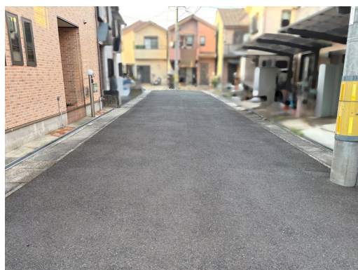
駐車スペース:幅約5560mm x 奥行約2410mm 令和7年度固定資産税・都市計画税:66,955円