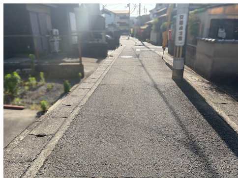
現状上物:木造瓦・垂鉛メッキ銅板葺/1階40.9㎡ 2階53.31㎡/1971年8月築/1989年5月増築 私有地 官有地