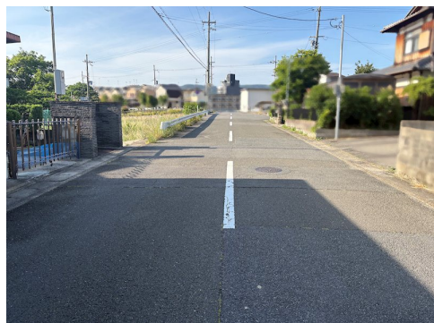
上物：家屋:木造瓦葺2階建/1階121.32㎡2階37.29㎡延床面積188.61㎡/1983年10月築・車庫:鉄骨垂鉛メッキ鋼板葺平家建/延床面積33.25㎡