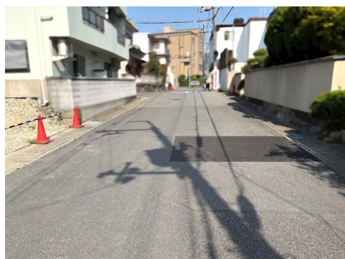
別途私道負担約41.91㎡有 公簿面積：297.31㎡(私道負担部分含む)