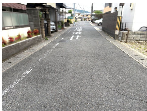
地積更生登記のうえ引渡