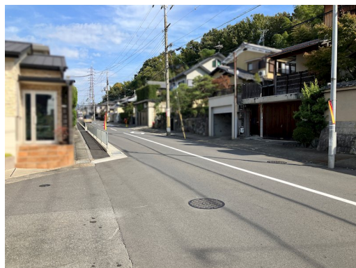
売主の契約不適合責任免責 現状有姿取引