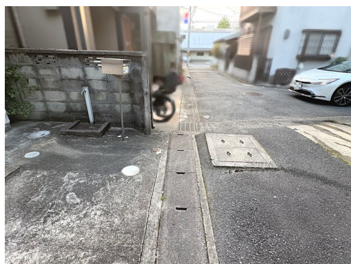
私道負担約4.44㎡土地面積に含む 北側非道路につき再建築不可