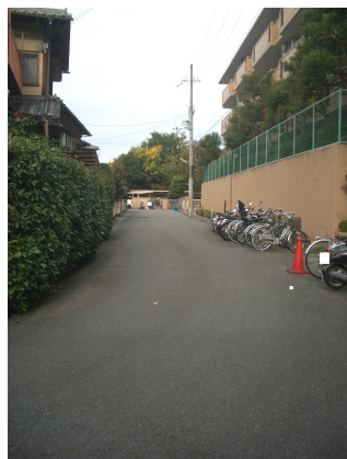
スギ薬局御陵店800m・ラクト山科ショッピングセンター990m 売主の契約不適合責任免責