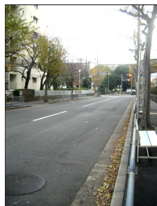
町会費：300円/月 固定資産税：46856円/年 現状渡し