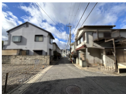
建物参考プランの場合:外構費用120万円(税込)・設計監理費用120万円(税込)別途要