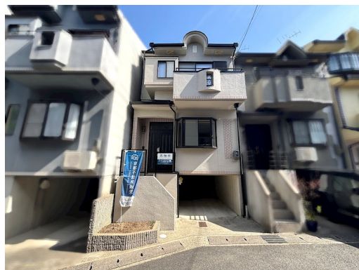
建物構造:木・鉄筋コンクリート造 司法書士指定有