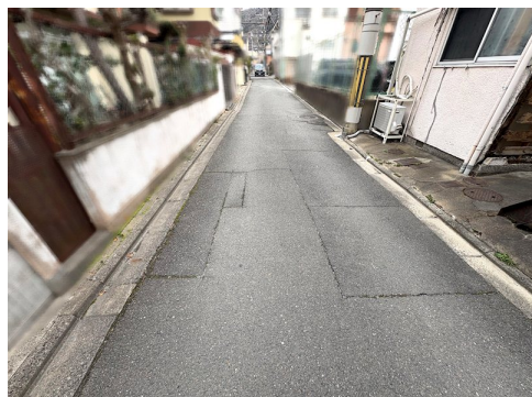
前面非道路（特定通路） 43条但し書きにより再建築可能 上物有:共同住宅/木造瓦葺2階建/1階30㎡ 2階30㎡延床面積60.0㎡