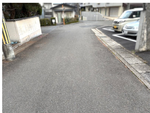
司法書士指定有 風致地区第3種地域