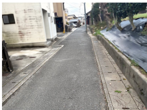
前面道路:認定道路(市道)幅員3.00~3.55m 売主の契約不適合責任免責