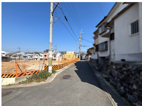
道路斜線制限・隣地斜線制限・北側斜線制限有