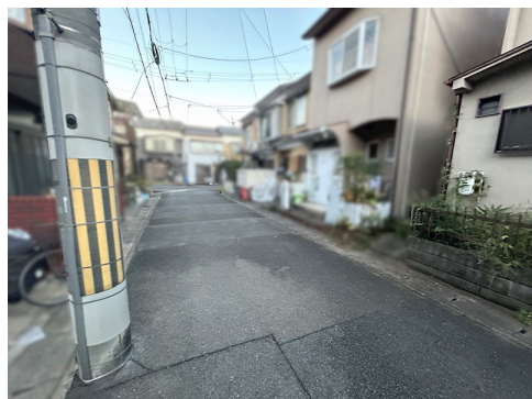
西隣と連棟 別途私道負担約13㎡有