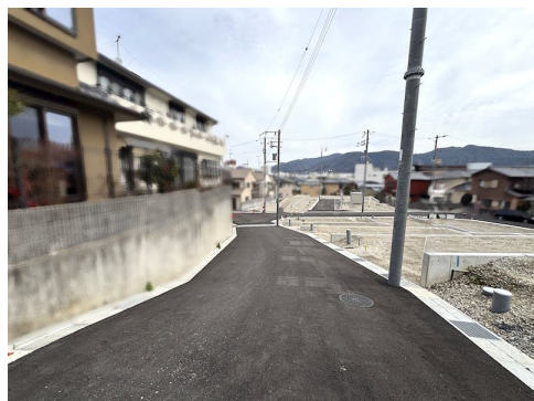
建築条件外しはご相談ください