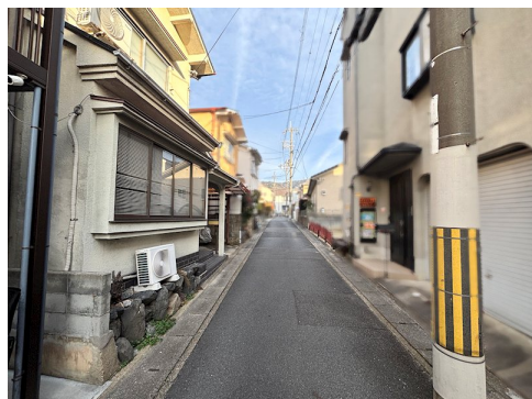
セットバック約0.33m 2 要 建物参考プランで建築の場合、設計監理費用120万円(税込)・外構費用110万円(税込)別途要