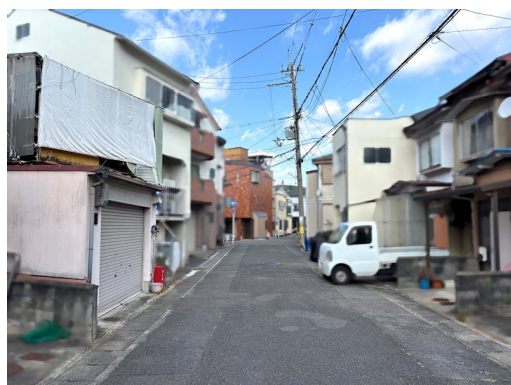
延床面積103.66㎡ 建ぺい率超過 倉庫兼車庫への駐車車種制限有