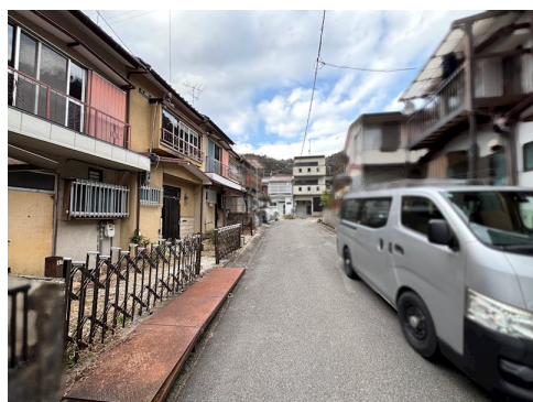
司法書士指定有 公簿面積:129.21㎡