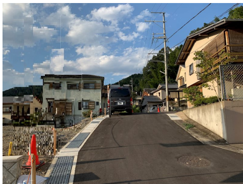
風致地区第3種地域 土砂災害警戒区域（急傾斜及び土石流） 擁壁の法面24.59㎡有 前面道路拡幅認定申請中