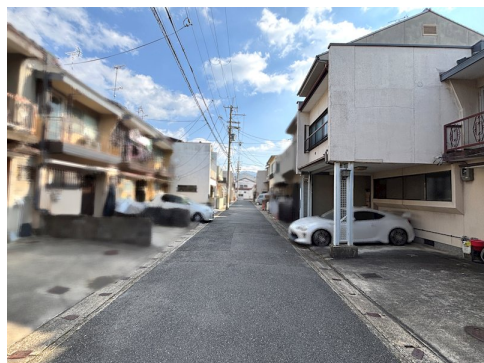
私道負担約20㎡土地面積を含む