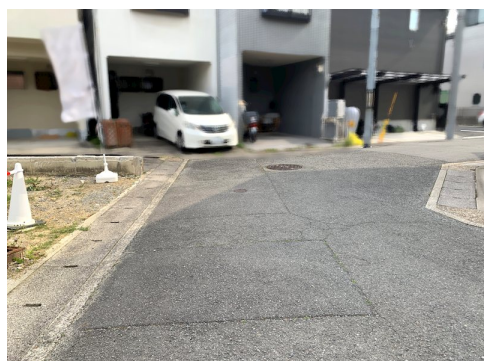
契約後3カ月以内に売主との請負契約を要する 私有負担約29.12㎡土地面積に含