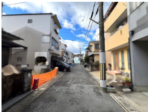
公簿面積:55.29㎡ 私道負担約11.36㎡ (実測) 土地面積に含

現況と異なる場合には現況を優先します。 該当物件が建築条件付き宅地だった場合、土地売買契約締結後3カ月以内に売主と住宅の建築請負契約を締結していただくことを条件として販売いたします。 この期間内に住宅を建築しないことが確定したとき、または住宅の建築請負契約が成立しなかった場合は、土地売買契約は無効となり、 受領した金額は全額無利息でお返しします。