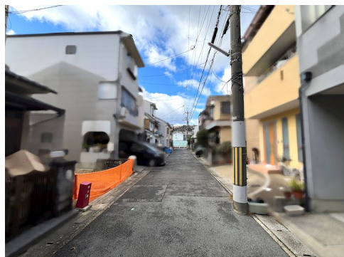
公簿面積:55.29㎡ 私道負担約11.36㎡ (実測) 土地面積に含