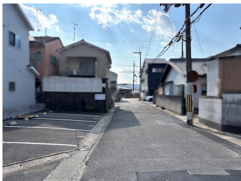
角地の為、建ぺい率70% 司法書士指定有