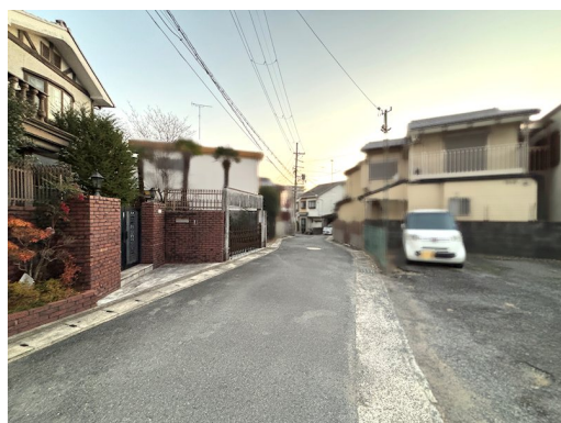
売主の契約不適合責任免責(付帯設備含) 建ぺい率・容積率超過