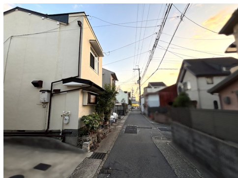
セットバック面積:0.6㎡有