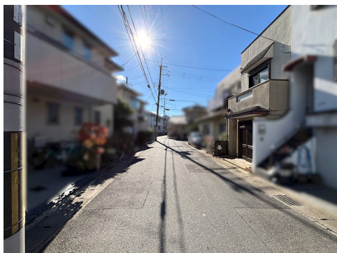
建物詳細:木造瓦葺2階建/1階 53:85 2階 35:78/昭和45年1月31日新築