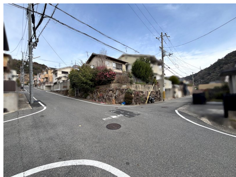
建物詳細:木造瓦葺2階建/1階 53:85 2階 35:78/昭和45年1月31日新築