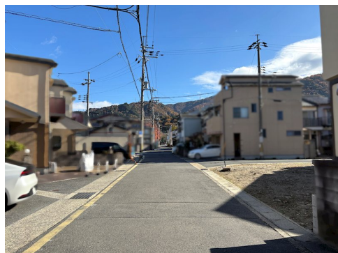
西側隣地の境界ブロックの一部越境有（覚書取得済）