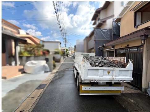
私道負担約14.6㎡土地面積に含