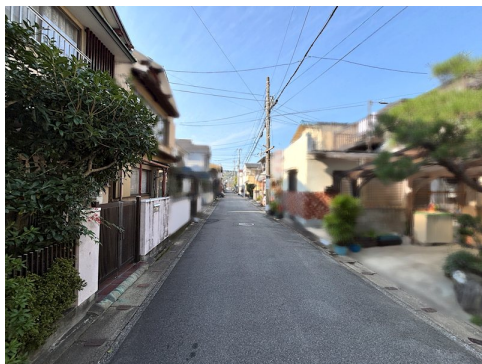
上物:木造2階建/延床面積66.51㎡ 売主の契約不適合責任免責

現況と異なる場合には現況を優先します。 該当物件が建築条件付き宅地だった場合、土地売買契約締結後3カ月以内に売主と住宅の建築請負契約を締結していただくことを条件として販売いたします。 この期間内に住宅を建築しないことが確定したとき、または住宅の建築請負契約が成立しなかった場合は、土地売買契約は無効となり、 受領した金額は全額無利息でお返しします。