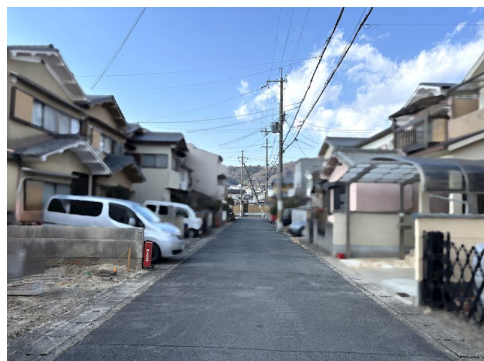
土地先行決済要す 建築確認申請費用77万円/外構費用99万円/省エネ申請費用22万円(全て税込)別途要