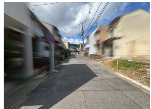
仮測量面積92.54㎡（公簿面積:92.54㎡） 外構費：120万円(税込)別途要 設計監理費用：120万円(税込)別途要