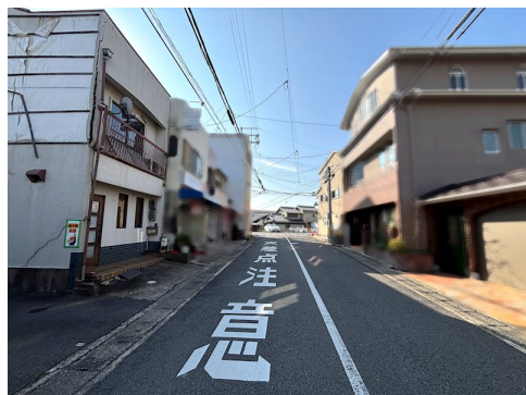
売主の契約不適合責任免責 境界非明示