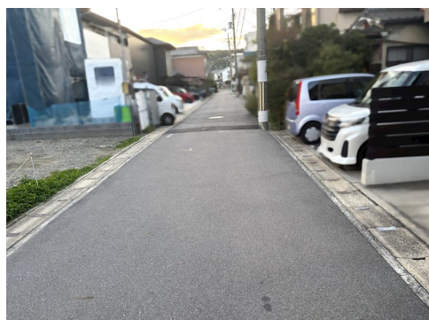
設備:本管有・引込無 現状渡し 開発非該当申請、買主にて要 別途私道負担約15.5㎡有