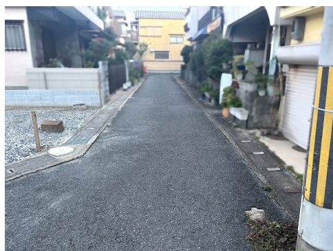
登記自に実測の結果、面積が多少相違することがあります