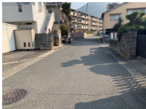
現況：電動シャッター付ガレージ