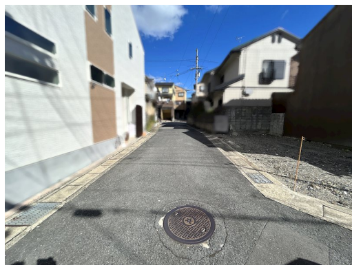
延床面積に車庫11.32㎡含む 図面と異なる場合は現状優先