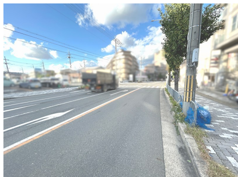
現況：駐車場 公営水道・都市ガスは敷地内引込無し