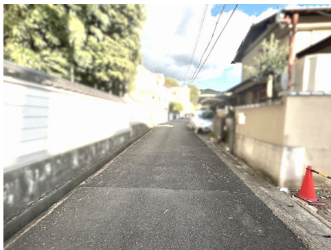
仮測量：213.27㎡ 設計申請日・地盤調査費・外構費等は別途要 風致地区第3種地域 埋蔵文化財包蔵地内