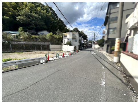
水道負担金88万円別途要 外構工事別途要 風致地区第3種地域 土砂災害警戒区域