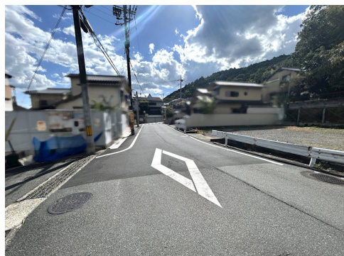
水道負担金88万円別途要 外構工事別途要 風致地区第3種地域 土砂災害警戒区域