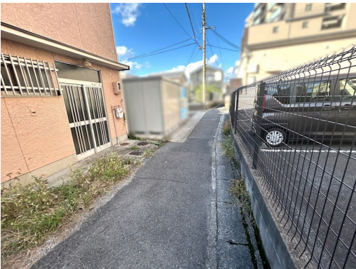
前面道路公道：西側:幅員約2.18m～2.23m/約4.15m接面 建物改装要す 建築基準法第42条2項道路 山科区榎辻5号線 道路後退面積約3.73㎡ 道路提供部分約0.80㎡