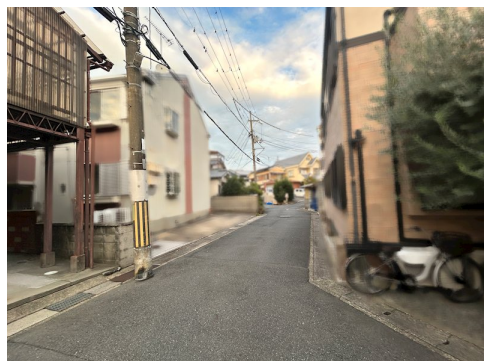
私道負担約24.71㎡土地面積に含 売主の契約不適合責任免責 現状有姿・公簿取引