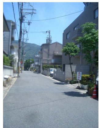
駐車場：8000円～10000円/月(空き状況要確認)